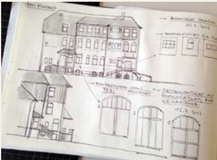
Skizzen zum Setdesign von Christian Strang