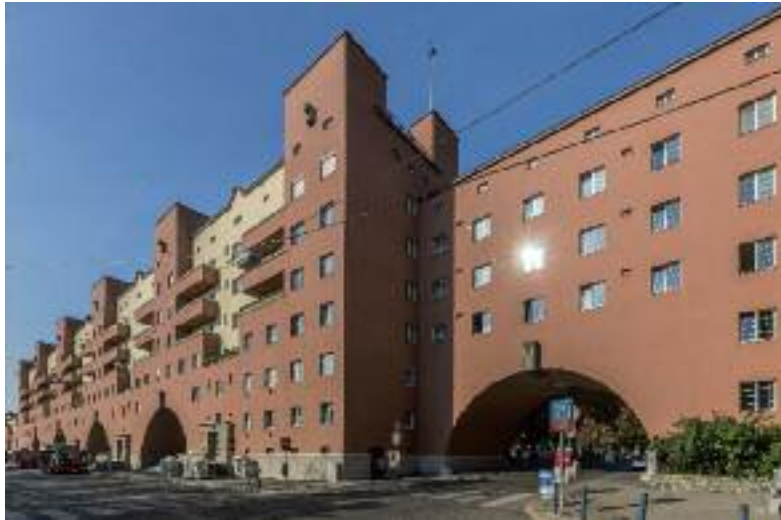
Der Karl-Marx-Hof, ein Gemeindebau im 19. Bezirk Wiens mit ursprünglich 1382 Wohnungen, wurde im Oktober 1930 bezugsfertig. Er gilt mit einer Front von einem Kilometer als der längste zusammenhängende Wohnungsbau der Welt

Finanzmärkte in die lokalen Märkte hinein. Sie sind es, die in einem zweiten Schritt Gewinne aus den Nachbarschaften durch Dividendenausschüttungen wieder in den Spekulationskreislauf einspeisen. Das Ergebnis ist nicht nur eine Umverteilung des Vermögens von lohnabhängigen Mieter*innen an die Anleger*innen und Investoren. Es entsteht auch eine wirtschaftliche Instabilität, die weit über den Berliner Wohnungsmarkt hinausreicht: Die nächste Immobilienblase wird mit der aktuellen Spekulation bereits vorbereitet.